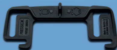
Compresseur en plastique Presslok