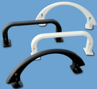
Poignées pour valisette