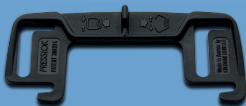
Plastik-Niederhalter Presslok / Plastic compressor bars Presslok