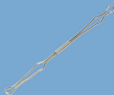
Draht-Niederhalter NH 65 / Wire compressor bars NH 65