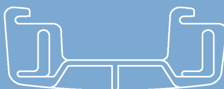
Plastic-Niederhalter Presslok / Plastic compressor bars Presslok